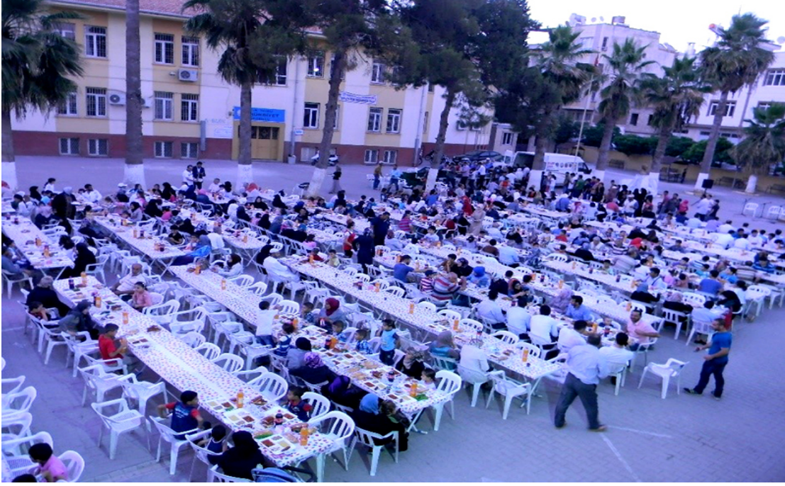
Resim 2: 2018 Yılı İftar Programından Bir Görünüm