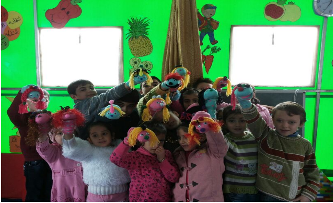
Resim 1: Çocuklarla Birlikte Yapılan Kukla Etkinliği

kendilerini ifade edebilecekleri, güvende hissedebilecekleri, sosyalleşme ihtiyaçlarının giderildiği akranlarıyla oyun oynayabildikleri faaliyetleri düzenlenmektedir. Yaygın eğitim temelli faaliyetlerinin yapıldığı alanlarda çocuklar ve gençler kendilerini ifade etme imkanı bulmakta ve akranlarıyla öğrenme süreçlerine devam etmektedirler. Bu merkezde aynı zamanda aileler ile de etkinlikler düzenlenerek ailelerinde çocuklarının öğrenme ve desteklenmesi sürecine katılmaları sağlanmaktadır.