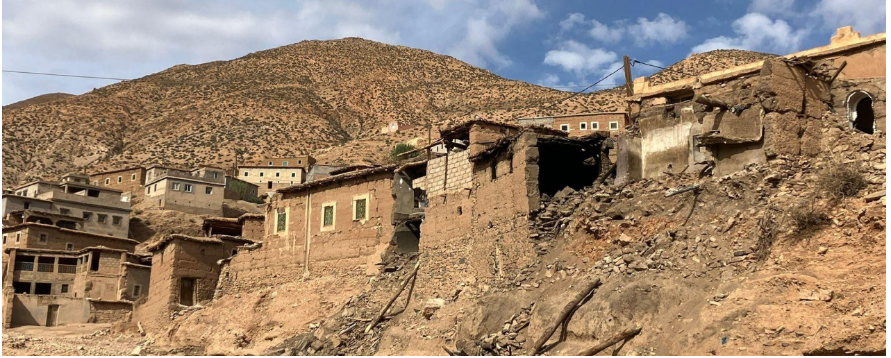
Takaterte köyü son depremde yerle bir oldu.

Eğitim Bakanlığı'nın verdiği rapora göre 530 okul ve 55 yatılı okulun hasar gördüğü, depremde en şiddetli darbenin ise Chichaoua ve Taroudant eyaletlerinde yaşandığı bildirildi. Yerel ve ulusal karayollarındaki barikatları temizleme, yolların yeniden açılmasına ve uzak dağ köylerine erişimin sağlanmasına yönelik çabalar sürüyor. 3 18 Eylül'de öğrenciler depremden etkilenen bölgelerdeki okullara geri döndü. Marakeş şehrinde yaklaşık 6.000 öğrencinin barınabileceği çadırlar kuruldu. 4