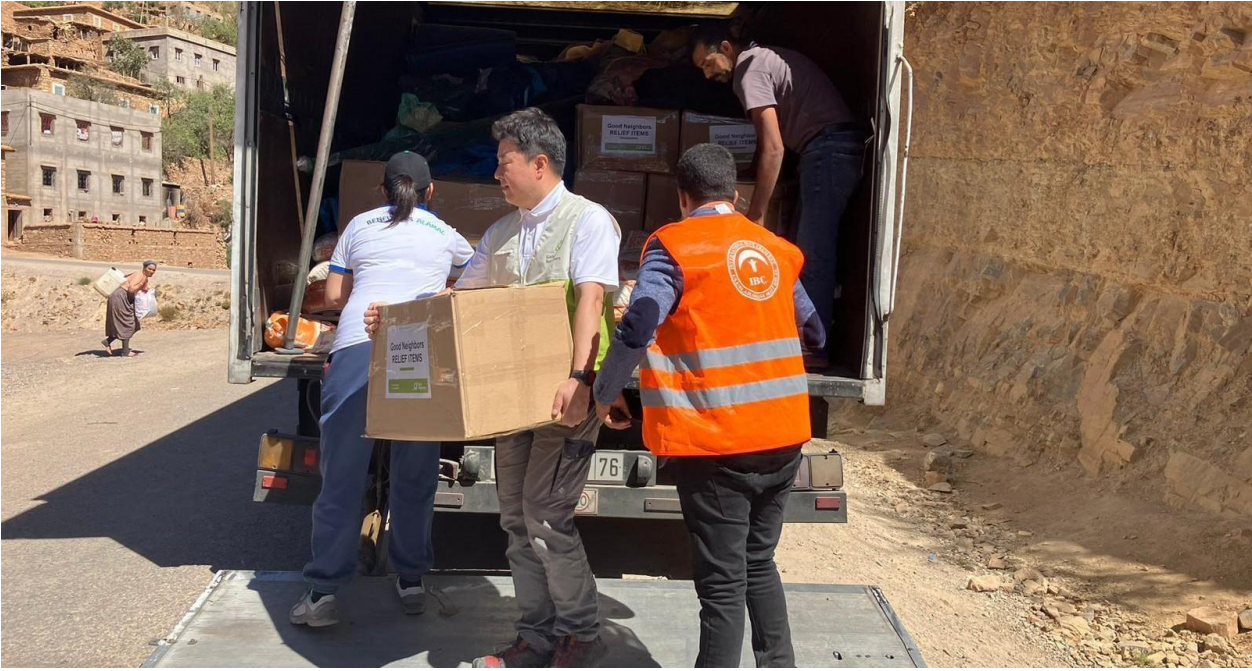
Gıda paketi dağıtımları, Takaterte / Ahl Tifnout

IBC ve bağışta bulunan IDRF, 14 Eylül tarihinde 3 saat süren karayolu ulaşımı ve akabinde devam eden 2 saatlik dağ yürüyüş sonrasında depremden ciddi şekilde etkilenen Ijoukak adlı küçük bir köye ilk ulaşanlardan oldu. IBC, IDRF ile birlikte şeker, pirinç, yağ, çay, tuz, un, çocuklar için kurabiye vb. gıda paketleri dağıtarak depremden etkilenen 150 kişiye destek sağlamayı başardı.