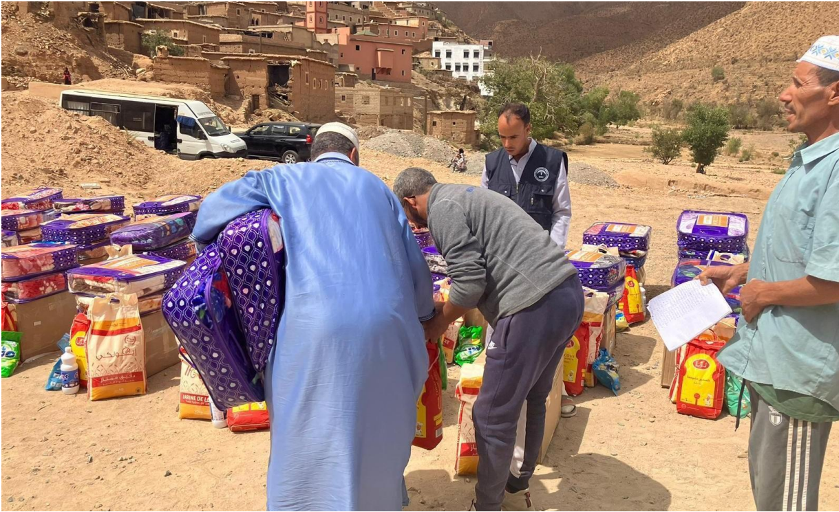
Gıda ve gıda dışı yardım (NFI) dağıtımı, Ahl Tifnout,

IBC, özellikle acil durum müdahalesi olmak üzere insani yardım ve kalkınma programlarının uygulanmasındaki geniş deneyimiyle, bağışçılar, ortaklar, yetkililer ve yerel kuruluşlarla etkin bir şekilde koordine oldu. İşbirlikçi yaklaşım, IBC'nin Ijoukak , Tinzart ve Taroudant 'taki insanların acil ihtiyaçlarını etkili bir şekilde karşılamasını sağlıyor. Vakıf, sıcak çorba, sıcak yemek, acil durum ve temel hijyen malzemeleri gibi önemli acil yardımlar sağladı. Son günlerde IBC , IDRF Kanada , Action Medeor ve İslamic Help UK gibi ortakların cömert desteğiyle, depremden etkilenen yüzlerce kişiye gıda kitleri, pişirme fırınları, çadırlar ve battaniyeler dağıtmak için özenle çalışıyor.